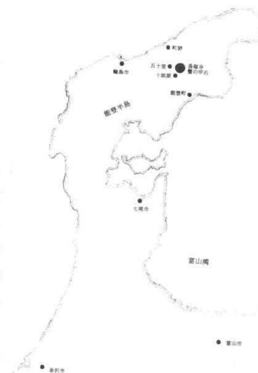
図1. 蟹伝説と関連する長福寺と蟹の甲石及びその付近の位置

現地には車で訪れた。金沢から能登有料道路を経てまず輪島市に行き、そこから日本海を左に見ながら北上し、町野で右折して県道277号線(宇出津町野線)を経由して旧柳田方面に向かった。小一時間かけて能登半島の背骨を越えて能登町に入るとやがて県道26号線(珠洲穴水線)に到達。T字路を右折して数キロm走ると蟹伝説の地五十里地域がある。町野川の上流を渡ると左手前方の小高い丘にお寺が見える。それが目指す「長福寺」であることを、道路脇で道を訪ねた農夫から教わった。同県道を左折して数百m進んで同寺に通ずる坂の入り口に到着。お寺の名を刻んだ石柱を見て、「ようやく着いたなー」と軽い安堵感がこみ上がってきた(図2、左)。