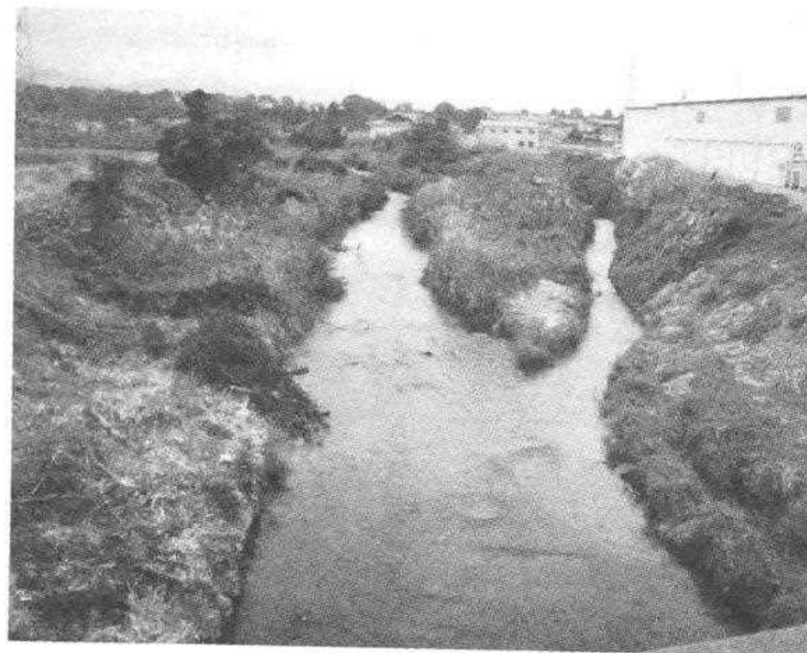
〔調査地点①：宮津橋〕 （1990年～1991年では調査地点⑨）

宮津橋の上流左岸から小橋川が流れ込んで合流している。小橋川と本流の両岸は、コンクリート護岸されている。1994年頃、河床の両岸に直径60cm程の敷石が多数並べられた。現在では敷石付近に土砂が堆積し、ヤナギやヨシなどの植物が繁茂している。また、敷石の隙間には淀みができており、所々に砂溜りがみられる。